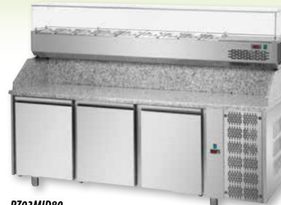
PZ03MID80 potenza assorbita 495W 2160 x 800 x h 1030/1100 mm temperatura 0° / 10° VR3215VD: 1.132,55 / 633,00 €