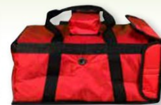
3 Realizzato in tessuto impermeabile Impertex, speciale imbottitura ad alto isolamento