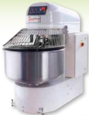
SIFAV60 700 x 1100 x h 1250 mm