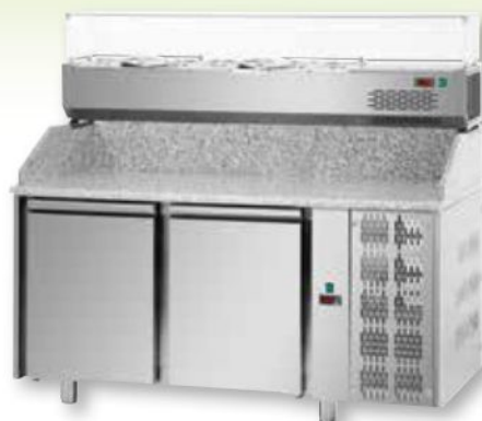
PZ02MID80 potenza assorbita 495W 1610 x 800 x h 1030/1100 mm temperatura 0° / 10° VR3160VD: 970,75 / 581,00 €