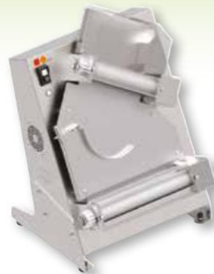
STPZ3202 250W 440 x 380 x h 615 mm per 80/210 gr di impasto